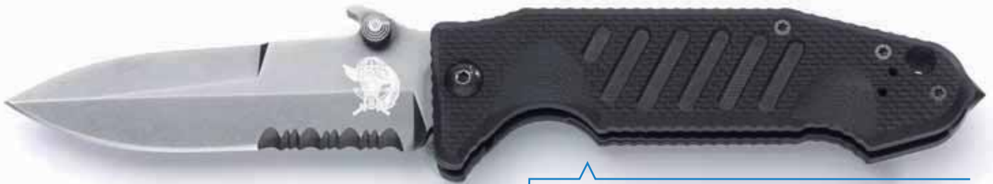
Il Delta Special Ops Col Moschin nella versione Big (grande)