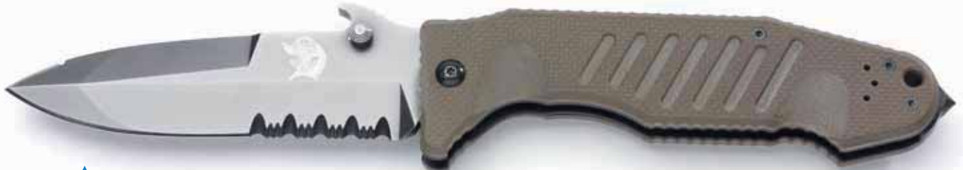
Il Delta Special Ops Col Moschin nella versione Big (grande)

tro è destinato a facilitare il lavoro della lama operando in trazione. Con questa finitura e configurazione la presa sul coltello è sempre molto salda, anche con le mani bagnate o indossando guanti tattici; per lo stesso motivo è previsto sulla lama un tratto solcato orizzontalmente per l'appoggio del pollice. La lama ha un falso controfilo che le conferisce, in punta, un disegno quasi simmetrico il quale si agevola l'uso in penetrazione. Il controfilo non è affilato, per non ridurre troppo gli spessori in prossimità della punta, peraltro già robusta perché fin quali in prossimità di essa l'asse della lama conserva il pieno spessore. Poiché può capitare di dover tagliare funi o materiali fibrosi, ma anche perché sul