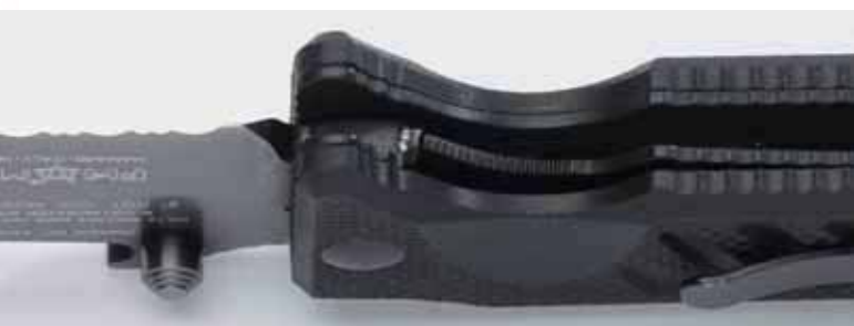
Un dettaglio del sistema di chiusura "liner lock". Si noti come la flangia si fletta verso l'interno per impedire il basculaggio

cizio, è come estrarre dalla tasca un coltello a lama fissa. Anche perché la lama aperta è immediatamente bloccata da un robustissimo liner lock. Studiata da professionisti per se stessi, questo è un coltello di cui ci si può fidare. Non solo a caccia o in campeggio, ma soprattutto negli impieghi gravosi e molte volte improvvisi del teatro d'operazioni.